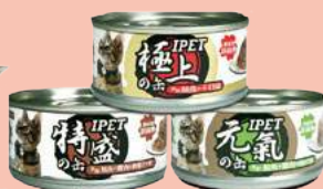
貓食系列 極上肉塊 / 特盛湯罐 / 元氣晶凍