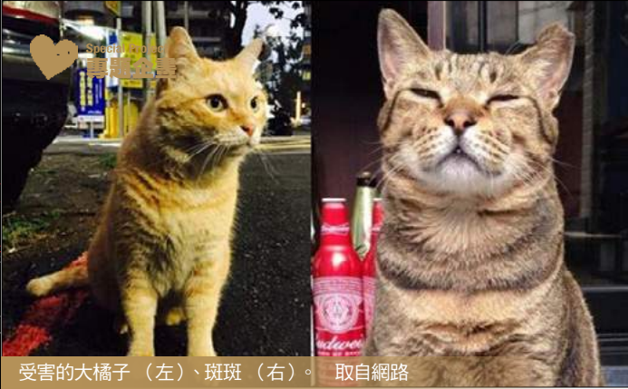
受害的大橘子（左）、斑斑（右）。