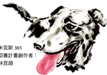
米克斯 365 認養計畫創作者： 林昆諤